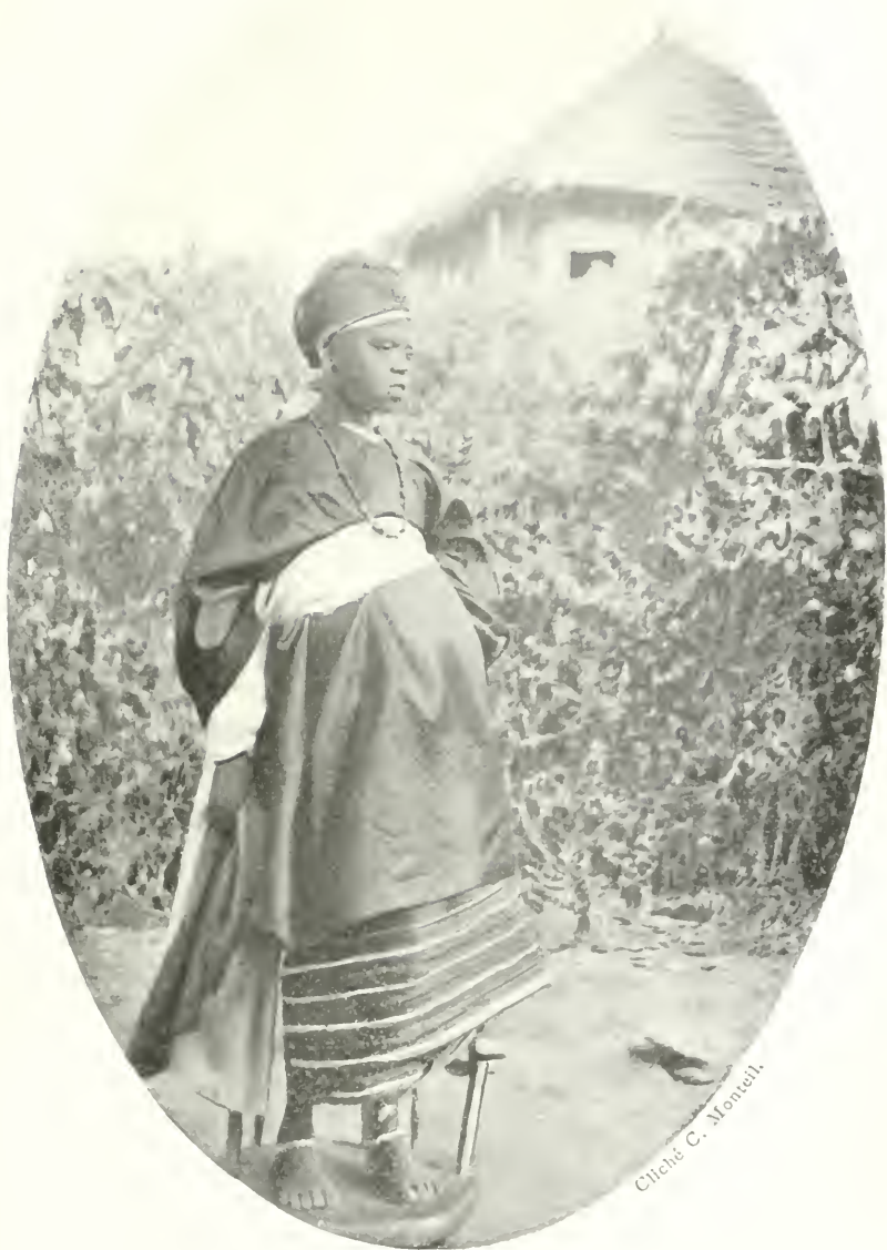
FIG. 4. — Jeune esclave du Khasso costumée pour la fête de l'excision.

A l'arrière plan, la haie d'épines sèches et une case de la tu de Sadyo Sambaïa.